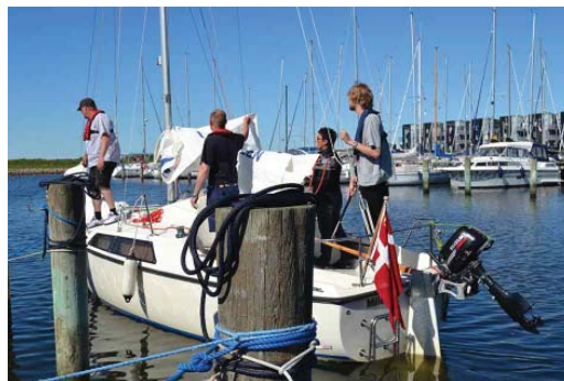
Underviser og elever på skolebåden Mille