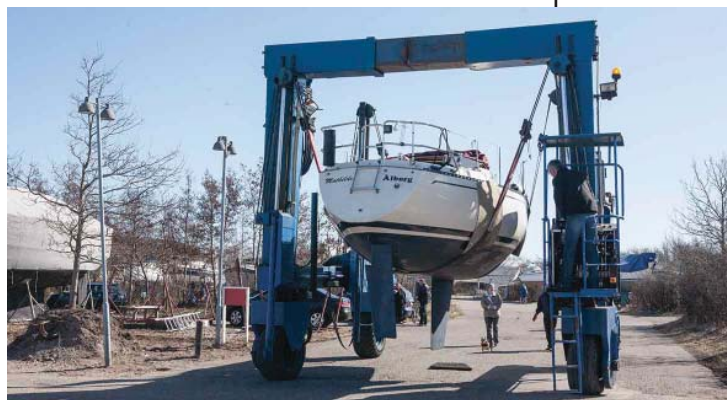
Traveliften i arbejde

Vi startede sæsonen med at åbne for vand og el - i år lidt senere på grund af frosten, men