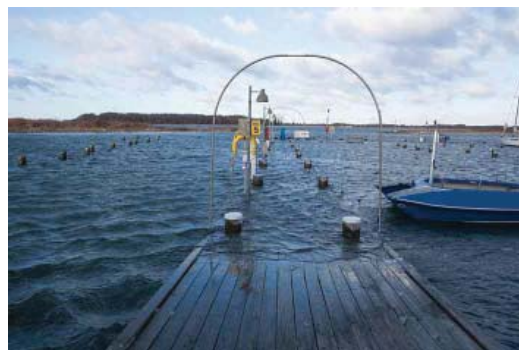
Orkanen Bodil raser - 6. december 2013

af vedligeholdelsen, til en gennemgang på stedet og det gav skub i interessen fra Aalborg Kommunes side til at kigge på det aktuelle plejeniveau for hele området. En del genopretningsarbejder med beskæring og fjernelse af uønskede vækster er igangsat / delvis udført og der er en løbende dialog i gang med klubben om - med fælles hjælp - at rette op på godt 25 års utilstrækkelig pleje af området. Ikke mindst pegede vi på den manglende vedligeholdelse af vej anlægget som i stort omfang hører under en anden afdeling – Trafik og Veje!