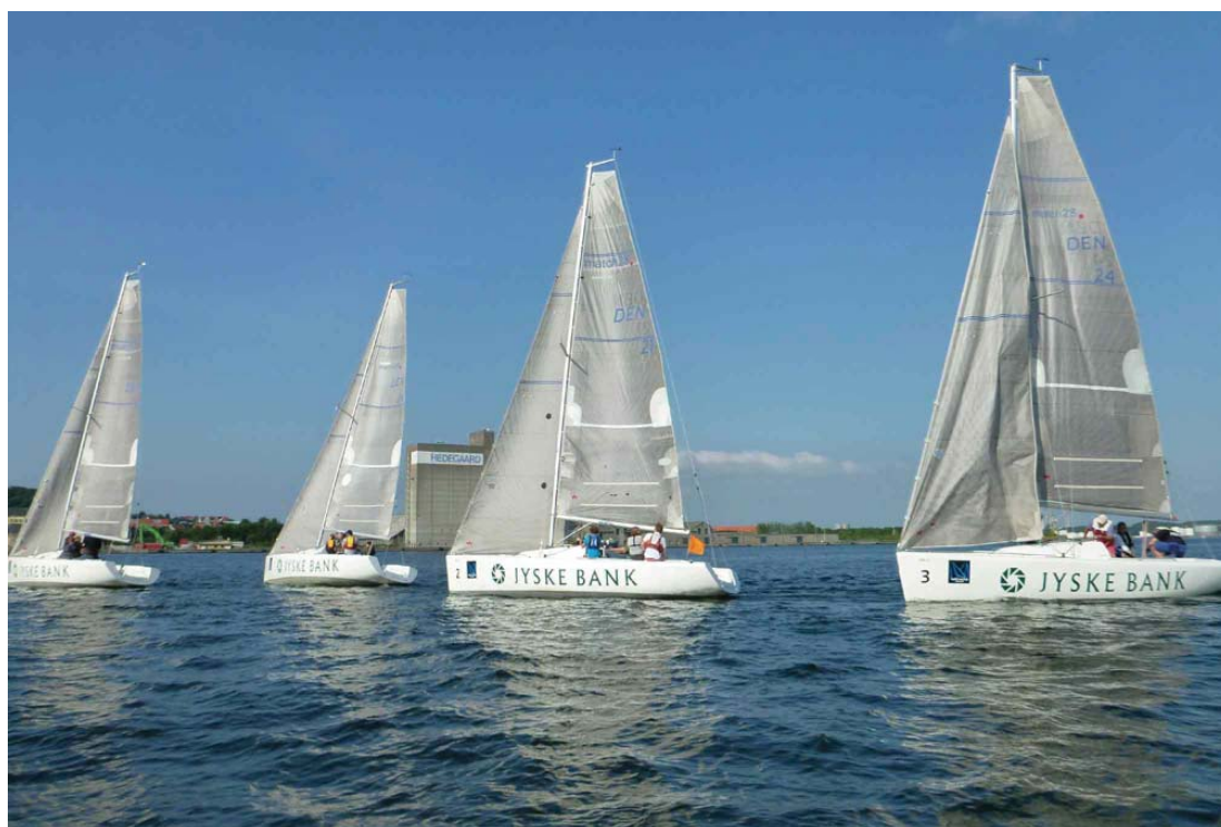
23. juni 2013: Aalborg Sejlklub stod for en række arrangementer i forbindelse med Aalborg Regatta. Bl.a. var der i samarbejde med Jyske Bank etableret matchrace øst for Limfjordsbroen - ud for Utzon Center og havnepromenaden.

Bestyrelsen er ifølge vedtægterne forpligtet til at arbejde for de bedst mulige vand- og landpladsforhold for medlemmerne. Dette forslag er fremsat i denne ånd.