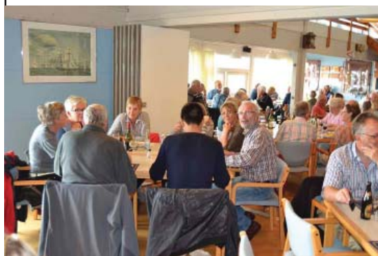
Sct. Hans aften 2013

V interen igennem er der fredagsbar - hver fredag fra 16-18. Medlemmer skiftes til at passe den, og deltagere møder trofast frem. Oprindeligt var jeg var sikker på, at det absolut ikke var noget for mig, men jeg må indrømme, at det er hyggeligt. Folk mødes kort over en øl, vand eller lidt vin og får en hyggelig sludder. Vi forsøger at få medlemmerne til at